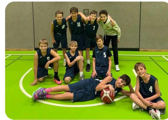
Herr Schüler beim Advents- und Trödelmarkt, Projekt „Gemeinsam Klasse sein!“, Naturwissenschaftlicher Nachmittag, Experimentieren in HuH, Rapido-Finale, Performance „Microspace“ auf Kamnagel, Gewinnerinnen des Vorlesewettbewerbs und die erfolgreichen Basketballer beim Wettbewerb „Jugend trainiert für Olympia“