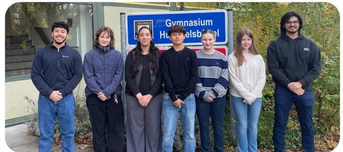
Die Hummelmacher - wir packen an, wo andere nur reden!