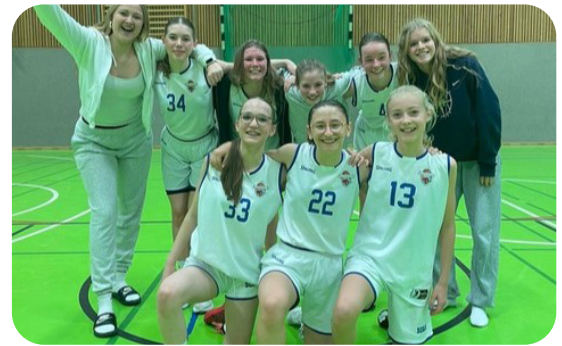
Das erfolgreiche Basketballteam