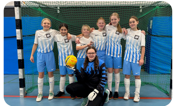
Unsere spielstarke Fußballmannschaft