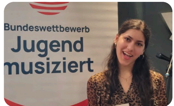
Kit singt sich auf den 2. Platz in der Sparte Musical