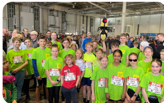
Alle schnell im Ziel - das Laufteam vom Zehntel