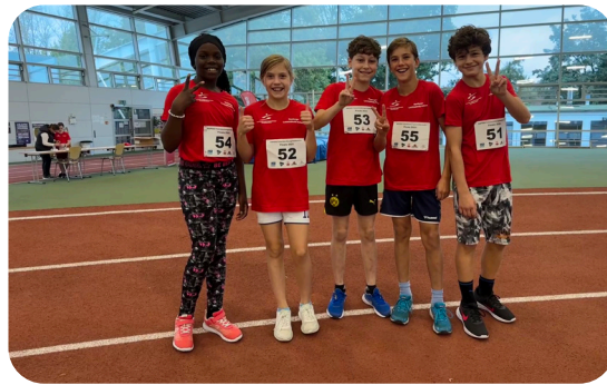
Unsere Fünftklässler/-innen bei Rapido

Die nächste Ausgabe wird im September erscheinen!