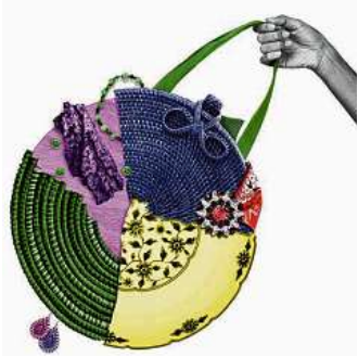
Mit allen möglichen Materialien zum Beispiel eine Tasche basten: das geht im Museum am Rothenbaum.

ROTHERBAUM Herausragendes Kunsthandwerk auf dem „MARKKet global – lokal“ im Museum am Rothenbaum MARKK gibt es zu sehen und zu kaufen. Früher hieß die Veranstaltung „Markt der Völker“ und war sehr beliebt. Durch Corona schrumpfte der Markt, doch jetzt lockt das bunte und vielseitige Angebot kunsthandwerklicher Arbeiten wieder ins Museum. 42 Stände, Foodtrucks