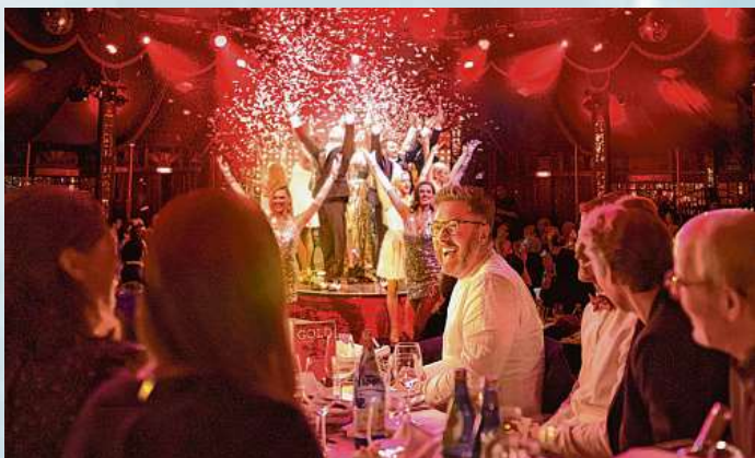
Die Gäste erleben bei ihrem PALAZZO-Besuch genussvolle Momente und vergnügliche Stunden.

Hotline 01806 388 883, (0,20 €/Anruf aus Festnetz; Mobilfunk max. 0,60 €/Anruf)