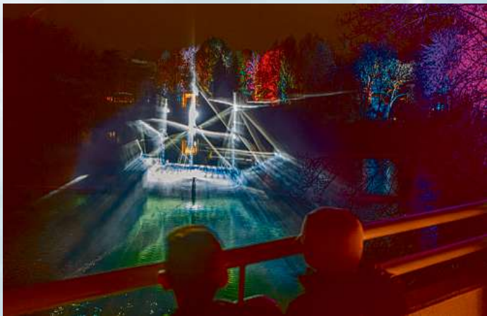
Der Loki-Schmidt-Garten wird winterlich-weihnachtlich illuminiert.

seine Tore öffnet. Funkeln-de Lichtpunkte und mit viel Herzblut inszenierte Installationen ziehen die Gäste in ihren Bann und verzaubern mit exklusiv für den Christmas Garden komponierten Soundkreationen. Im Christmas Garden Hamburg erwartet das Publikum mit mehr als dreißig Installationen und