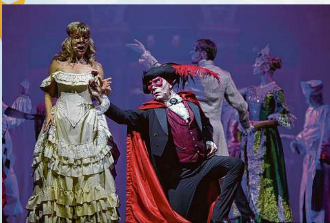
„Das Phantom der Oper“: Weltberühmtes Musical mit einer fesselnden Geschichte.