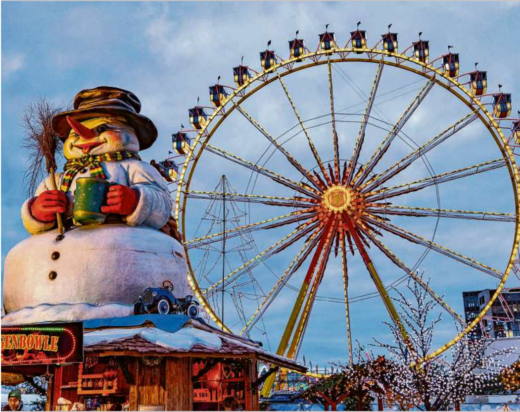
Winterliche Stimmung auf dem Heiligengeistfeld.

„Der Winterdom steht ganz im Zeichen der Familientage. Das Besondere: An drei Familientagen findet jeweils ein Event statt. Die Dom-Besucher können sich auf eine Gruselparade, einen Lichter- und Laternenlauf sowie eine Nikolaus-Aktion mit Glücksrad freuen“, erläutert Sascha