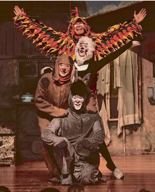
Esel, Hund, Katze und Hahn sind die ungewöhnlichste Band überhaupt.

In dem bekannten Märchen nach den Gebrüdern Grimm geht es um Freundschaft, Hilfsbereitschaft und Mut; die musikalische Inszenierung bereitet Klein und Groß im Publikum Spannung und Freude. Traditionell gibt es vor dem Stück und in der Pause Schoko-Sterne, Clementinen, Äpfel und Getränke. Karten kosten 7 Euro; Vorverkauf in der Bücherhalle Fuhlsbüttel und der Bücherstube Fuhlsbüttel. (blu)