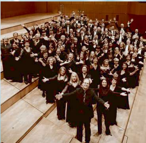
Der Philharmonische Chor München.

Di, 9. Januar, 20 Uhr, Elbphilharmonie, Karten von 49 bis 79 Euro, an allen VVK-Stellen und elbphilharmonie.de