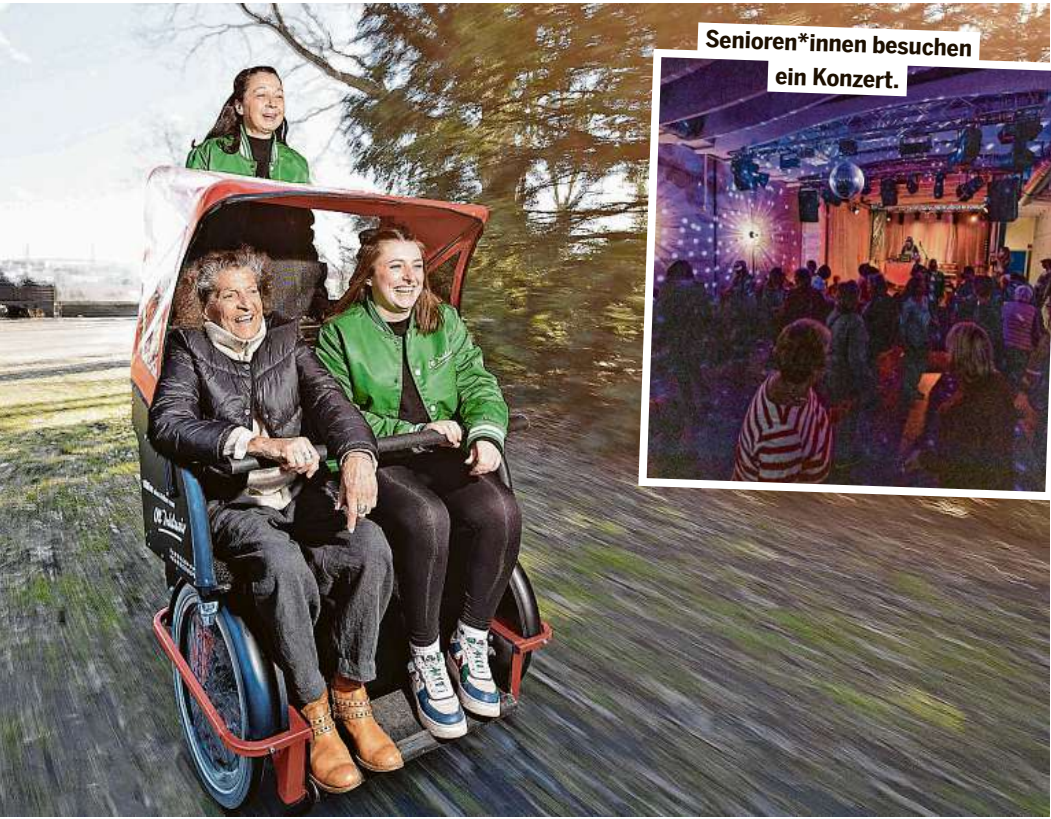
„R'Oll on“, der kostenlose Rikscha-Service.

INITIATIVE lockt Senioren*innen hinaus in die Welt