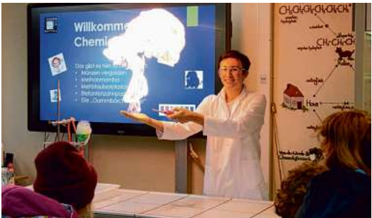
Vor allem Experimente zogen das Interesse der Schülerinnen und Schüler magisch an.