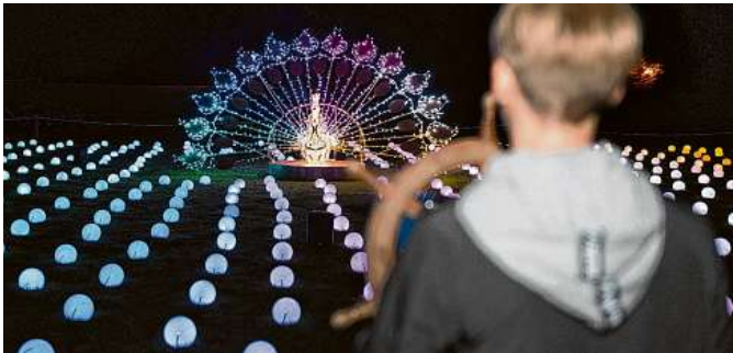
Wow-Effekt im Wildpark Schwarze Berge: Auch ein interaktiver Pfaue erhellt das Dunkel des Abends.

Wildpark Schwarze Berge, Vahrendorf, Am Wildpark 1, T 819 77 47, www.wildpark-schwarze-berge.de