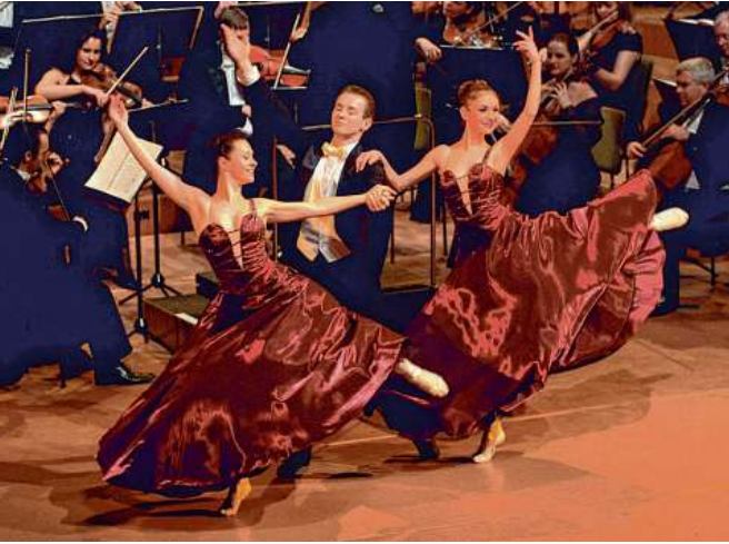
Auch das K&K Ballett tritt bei der Strauß-Gala in Hamburg auf.