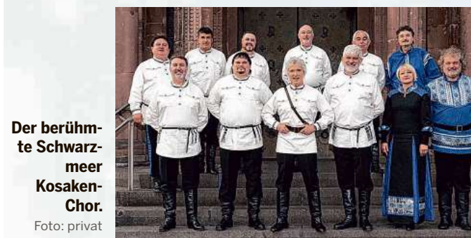
Der berühmte Schwarzmeer Kosaken-Chor.

Peter Orloff und die Schwarzmeer Kosaken