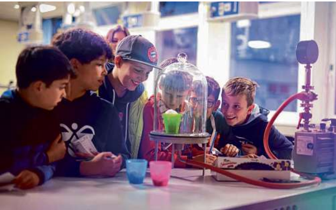
Der Naturwissenschaftliche Nachmittag lockte zahlreiche interessierte Kinder ans Gymnasium Hummelsbüttel.

HUMMELSBÜTTEL Viele kleine Nachwuchsforscher tummelten sich kürzlich in den Fachräumen des Gymnasiums Hummelsbüttel. Der Naturwissenschaftliche Nachmittag ist seit den 1990-er Jahren Tradition an dieser Schule. Denn schon damals hat ein Biologielehrer erkannt, wie wichtig es ist, jüngere Kinder an die großen Disziplinen der Naturwissenschaften heranzuführen – Biologie, Physik und Chemie.