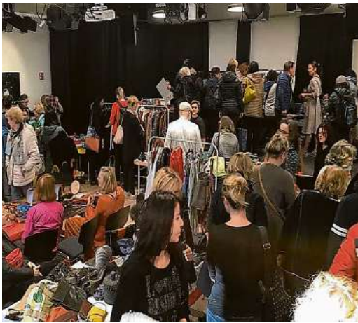
Stöbern in schönen und praktischen Lieblingsstücken ist wieder angesagt.

Zum letzten Mal in diesem Jahr gibt es ein Flohmarktweekende im Eppendorfer Kulturzentrum KUNSTKLINIK. Da ist sicher noch das eine oder andere Weihnachtsgeschenk zu finden. „Tausendschön“ steht für ein ausschließlich von Frauen präsentiertes nicht-gewerbliches Angebot von 1000 schönen und praktischen Lieblingsstücken, sauber, heil und in guter Qualität aus den Bereichen Mode, Accessoires, Haushalt, Wohnen, Bücher, Unterhaltung, Technik, Sport, Kurioses. Nicht zu finden sind Herren- oder Kindersachen, reines Kinderspielzeug. Genießt „Tausendschön“ an vier Wochenenden im Jahr in den hellen Räumen der KUNSTKLINIK mit der Chance auf viele nette Begegnungen in der Zeit von 10 bis 16 Uhr. Sonntags mit neuen Ständen. Die Stände bleiben bis zum Veranstaltungsende aufgebaut. Männer sind als Besucher, Käufer und Aufbauhelfer herzlich willkommen.