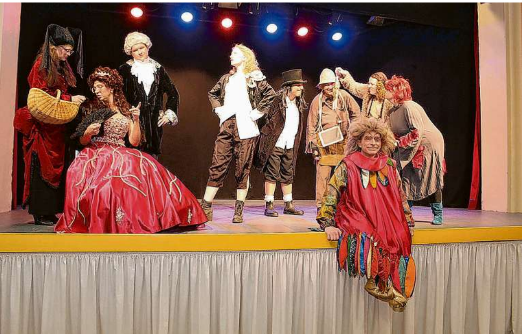
Mit Herz und Leidenschaft stehen die Amateurschauspieler auf der Bühne des LaLi.

Weihnachtsstück der BÖRNER SPEELDEEL im LaLi