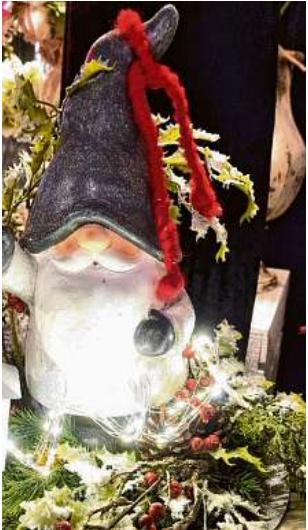
Wer noch Deko zum Fest sucht, wird sicherlich fündig.

Mit dem Blechbläser-Trio, den beliebten Wasserspielen, die sich einem Feuerwerk gleich in die Lüfte schrauben, Bogenschießen, der Märchenwerkstatt zum Basteln und Backen sowie einem Karussell für kleine Weihnachtsmarktbesucher, Begegnungen mit dem Weihnachtsmann oder inspirativen Vorführungen rund um adventliche Gestecke binden kann hier eine schöne Zeit verbracht werden. Der Veranstalter, die Home & Garden Event GmbH aus Lübeck, bietet einen Ticketvorverkauf auf www.lebensart-basthorst.de/weihnachtsmarkt.html für acht Euro pro Erwachsenenticket an. Kinder bis einschließlich 15 Jahre dürfen in Begleitung eines Erwachsenen gratis dabei sein. Der Weihnachtsmarkt auf Gut Basthorst ist vom 24. bis 26. November sowie an drei Terminen (1. bis 3. Dezember, 8. bis 10. Dezember, 15. bis 17. Dezember 2023) jeweils von 11 bis 19 Uhr geöffnet. Gratis-Parkplätze stehen zur Verfügung. (wb)