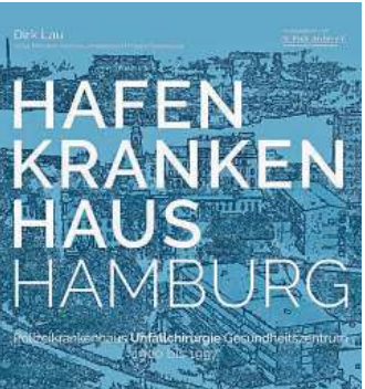
Der Text/Bild-Band „Hafenkrankenhaus Hamburg“ wurde bestes Hamburg-Buch des Jahres.