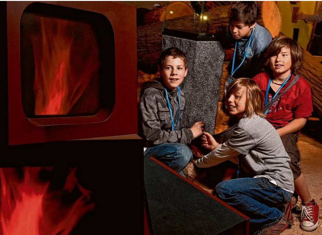
Mitmachstationen mögen junge Museumsbesucher*innen ganz besonders, denn Ausprobieren geht nun mal über Studieren.

HAMBURG Bis 28. April 2024 präsentiert das Archäologische Museum Hamburg ein Erlebnis der ganz besonderen Art: Die Ausstellung „Light my fire– Mensch macht Feuer“ dreht sich um eine der wichtigsten Entdeckungen des Menschen: das Feuer.